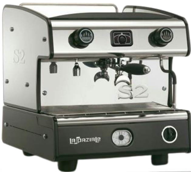
دستگاه صنعتی تک گروه