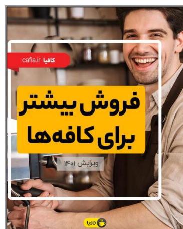
کتاب راهنمای افزایش فروش کافه

(۳) پیج اینستاگرام و کانال تلگرامی کافیا بازار