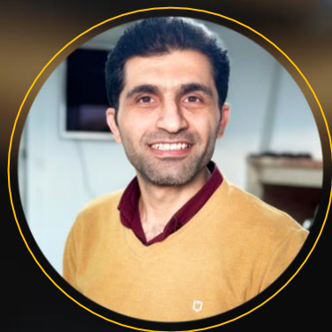
نوذری مدیر سایت کافیا

تذکر: «انتشار آزاد است اما دستکاری ممنوع»