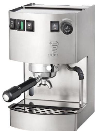
دستگاه نیمه صنعتی