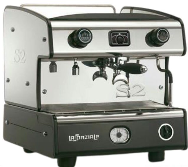
دستگاه صنعتی تک گروه