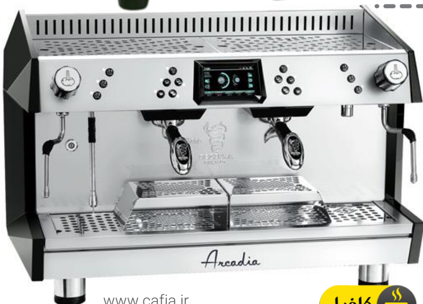
دستگاه صنعتی دو گروه